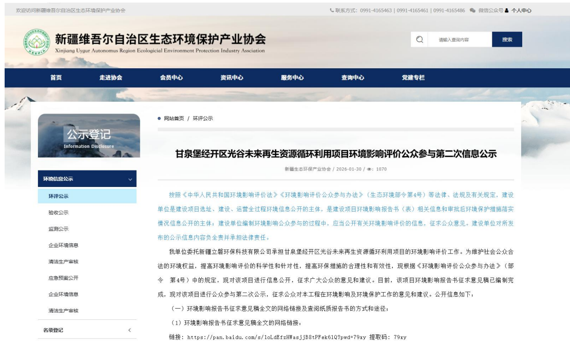
图2 本项目征求意见稿网络公示截图