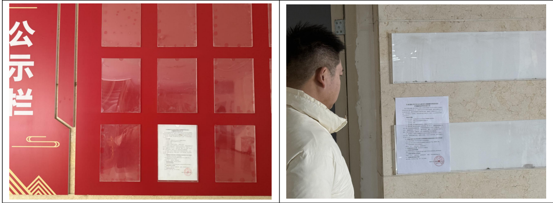
图 5 公示现场照片

根据《环境影响评价公众参与办法》，建设单位在 2026 年 2 月 2 日在项目周边居民村（九连连部）和园区管理委员会宣传栏张贴了公告，公示现场照片见图 5。